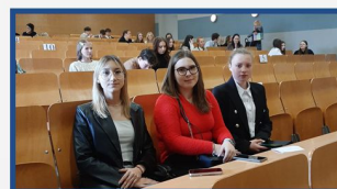
Olimpiada „Warto wiedzieć więcej o ubezpieczeniach społecznych”