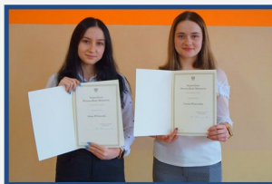
Stypendystki Prezesa Rady Ministrów